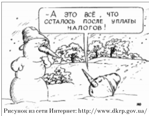
Рисунок из сети Интернет: http://www.dkrp.gov.ua/

1 Исследование проводилось в форме посещений и непосредственных опросов директоров или владельцев компаний в период с июня по август 1999 года. В большинстве стран были опрошены представители 125–150 компаний, в трех странах численность выборки была большей: Украина и Польша — по 250 компаний, Россия — 550 компаний. Выборка обеспечила достаточную репрезентативность внутренней структуры предприятий: были предусмотрены определенные квоты на основании размера, отрасли, местонахождения и экспортной ориентации. (См. статью «Результаты исследования ЕБРР и Всемирного банка свидетельствуют о панибратских отношениях между государством и предприятиями», «Трансформация», декабрь 1999 года, с. 6, а также «Measuring Governance, State Capture and Corruption», PRWPaper 2312 на веб-странице Всемирного банка в сети Интернет: http://worldbank.org/wbi/governance/ ).